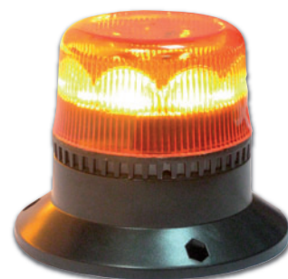
Feu avec embase ISO