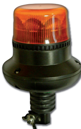
Feu avec embase hampe