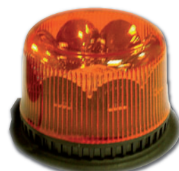
Feu avec embase magnétique